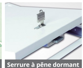
Serrure à pêne dormant