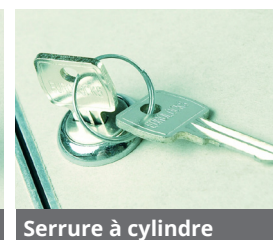
Serrure à cylindre